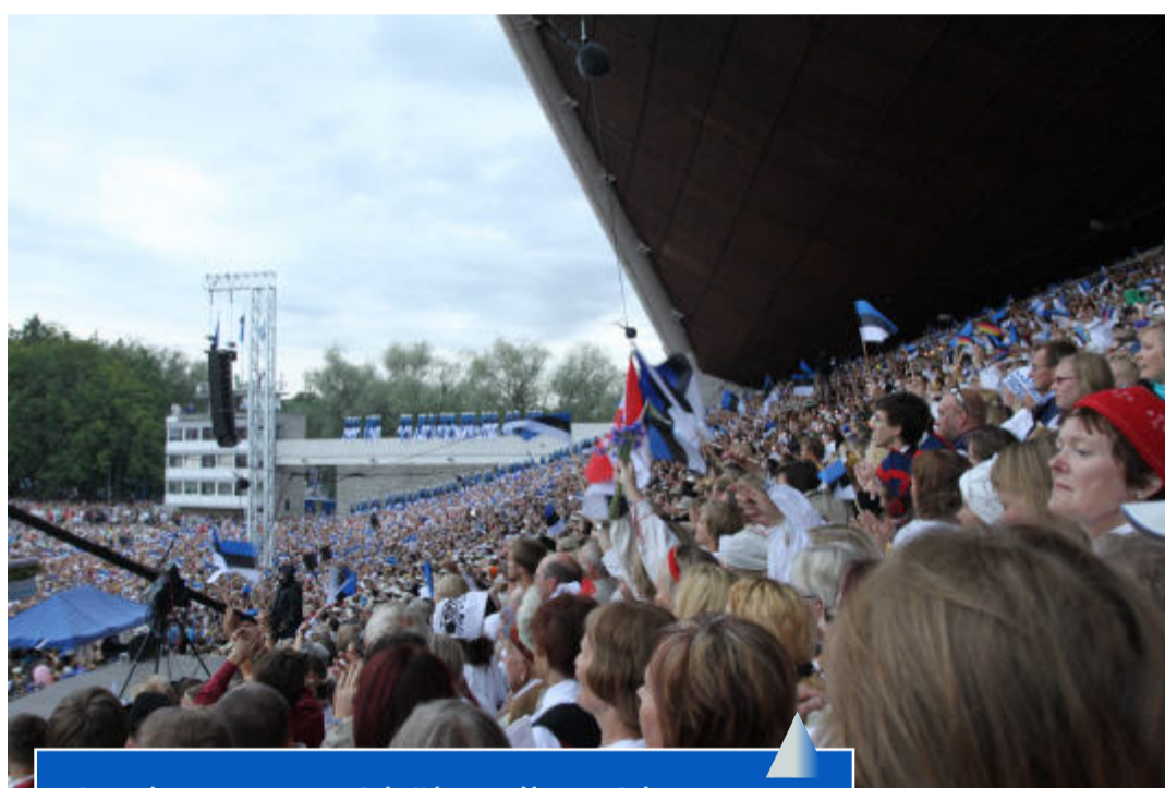
Laulupeo avasid ühendkoorid.

Ja siis algaski rivistus ning see oli suhteliselt karm kogemus. Just minu kõrval hakkas ühel lauljal paha ja ta polnud veel lavale jõudnudki. Rahvas oli nagu silgud pütis ja püüdis lavale pääsemiseni kuidagi (näiteks Õllepruulijat lauldes) aega veeta. Lavale pääsemine võttis ka oma- jagu aega, päris kahju oli vaesest liikumisjuhist, kes püüdis „pakitud“ inimmassi veelgi väik- semaks suruda.