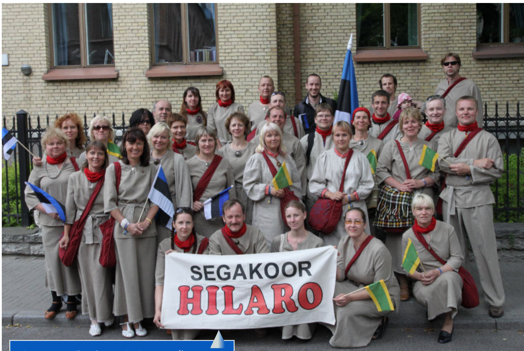
Asume vaikselt positsioone võtma.