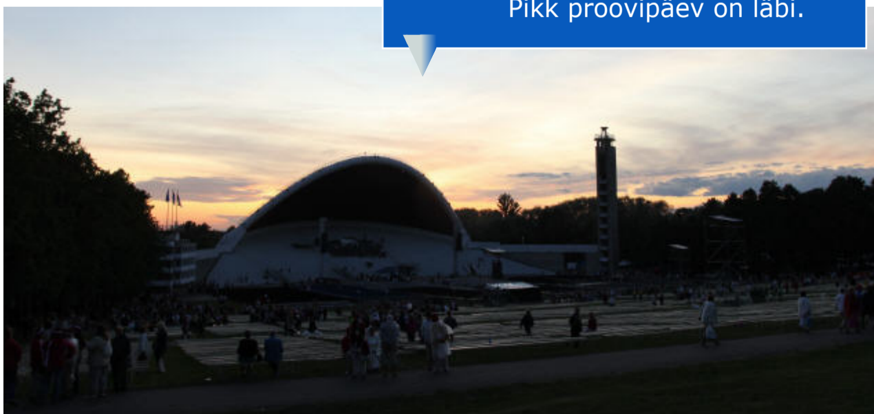
Pikk proovipäev on läbi.