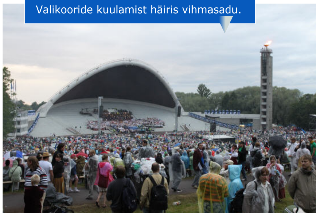
Valikooride kuulamist häiris vihmasadu.