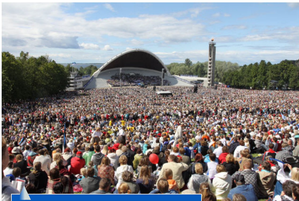
Publiku hulgas oli raske ka seismiseks raske vaba kohta leida.